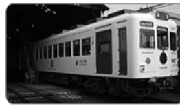
↑和歌山電鐵いちご電車 →和歌山都市圏公共交通路線図Wap

閉会 閉会后16:30~18:00まで、交流・懇親会(3,000円)があります。 是非、参加ください。